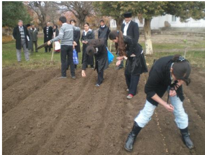
(1) Процесс создания питомника с участием школьников пилотных школ

Следующим шагом ОО «Зан ва Замин» в рамках этого проекта является создание коллекционных садов местных сортов в пилотных районах. В этом году планируется организовать 11 демонстрационных садов по выращиванию местных сортов на площади 4,2 га, с общим количеством саженцев 1735.