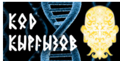
(1) Баннер рубрики на Акипресс

Так статьи для рубрики должны содержать интересный, познавательный материал по традиционной культуре кыргызов, подтвержденный фактами, написанные доступным, но не примитивным языком. Запрещается пропаганда межнациональной розни и расовой нетерпимости, проявление гендерной и религиозной нетерпимости, возвышение одной нации за счет унижения представителей других наций.