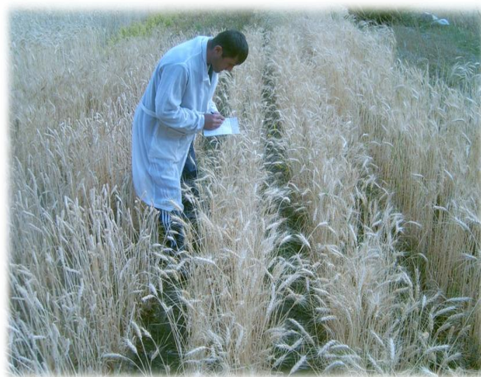
(1.2) Демонстрационный уч-к в Ишкашимском опорном пункте Памирского биологического института (2600 м. над уровнем моря)