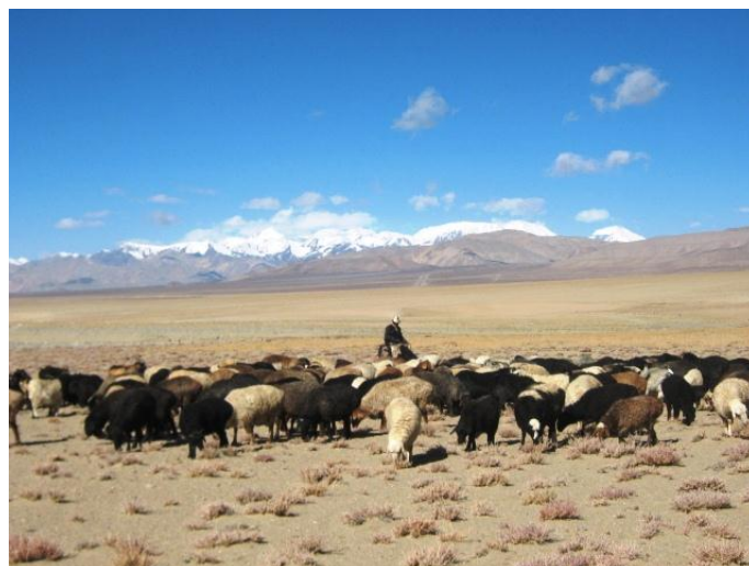
(1) Выпас скота на пастбище (Мургабский р-н)

На основе полученных исходных данных по основным видам пастбищ и для их рационального использования было создано 5 карт пилотных джамоатов и 1 общая карта пастбищ Мургабского района. На картах указывается местоположение пастбищ с названием, типом и сезонностью использования пастбищ. После тиражирования карты будут доступны для всех желающих и заинтересованных сторон.