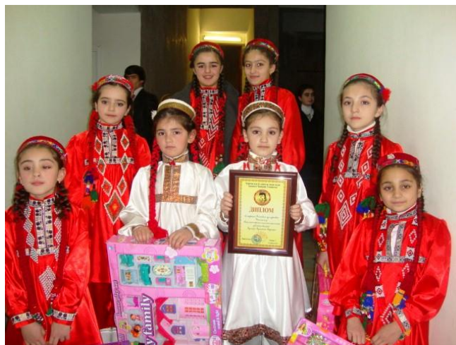
(1.2.) Участники детского фольклорного танцевального ансамбля «Аласт»