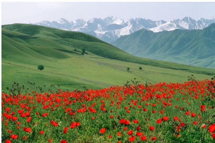
(1) Зима на пастбище ; (2) Маки