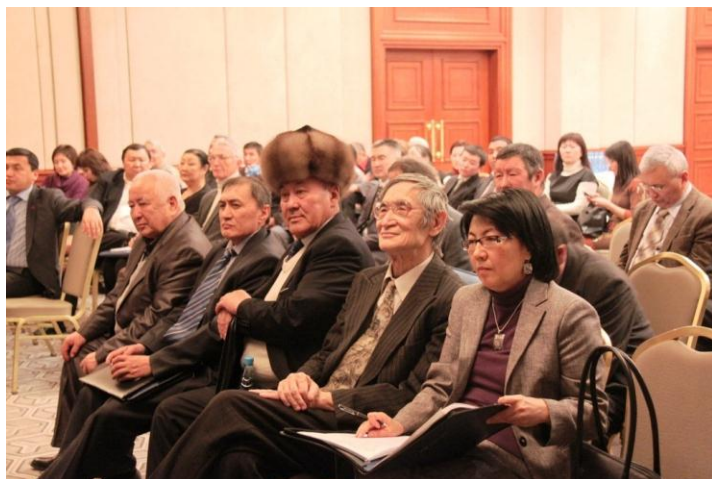
(2) На форуме