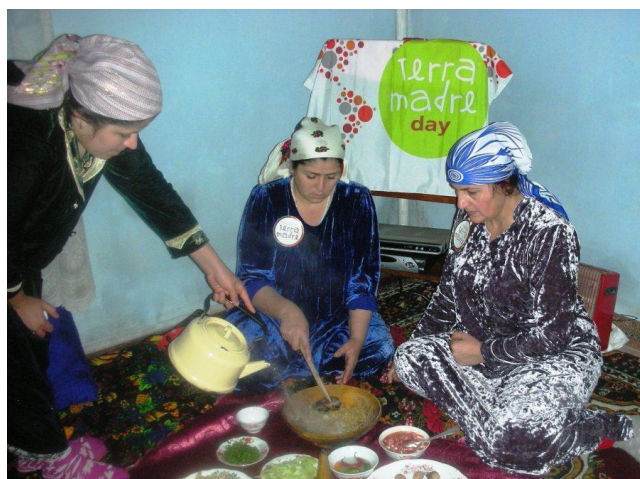
(1.2.) Празднование Дня Терра Мадре в местных сообществах