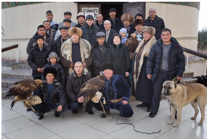
На фото: (1) аборигенная порода; (2) участники выставки