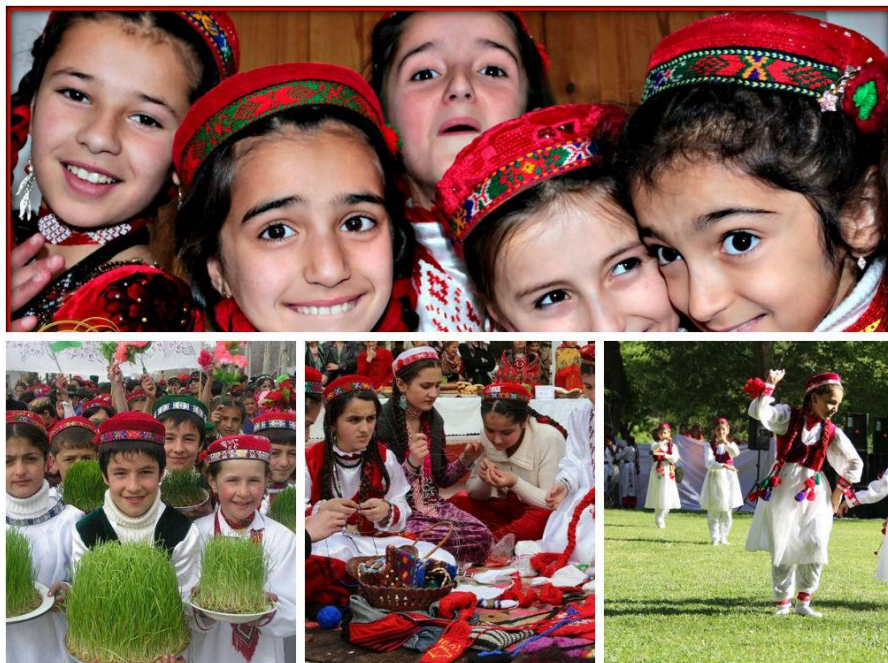
На фото: детская фольклорная группа «Аласт» на Наврузе

21 марта ОО «Молодежь за Горное развитие» (YMD) и детская фольклорная группа «Аласт» участвовали в торжественном открытии праздника Навруз, организованного местным Хукуматом ГБАО (Таджикистан), совместно с сообществами. Группа «Аласт» со своим традиционным номером с дойра (даф – бубен) и национальными танцами открыла мероприятие. В этот же день была также организована выставка народного творчества, кукол, сувениров и поделок из бисера и шерсти, работы творческих групп при ресурсном центре «Аласт». Выпускники Летнего лагеря «Аласт» также участвовали в мероприятиях в честь празднования Навруза на Кипре, в США, Кыргызстане и Казахстане, тем самым внося свой вклад в сохранение биокультурного наследия народов Памира не только в Таджикистане, но и во всем мире.