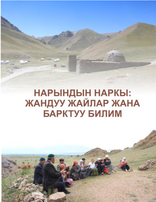
НАРЫНДЫН НАРКЫ: ЖАНДУУ ЖАЙЛАР ЖАНА БАРКТУУ БИЛИМ