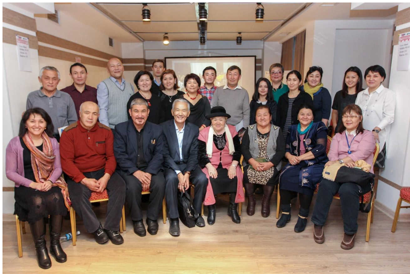
Общее фото участников (не)конференции