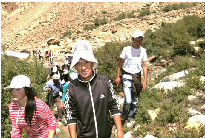
Поход в горы и «Путешествие вглубь времени»

проблемах современного мира. Походом в горы школьники совершили «Путешествие вглубь времени», пройдя воображаемый путь от зарождения нашей планеты до современных дней.