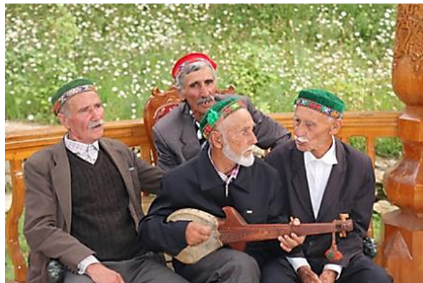
Местные хранители традиционной культуры Ишкашимского района в гостях у участников тренинга

Программа, составленная ОФ «Таалим Форум», была обсуждена и адаптирована для памирских слушателей. Были даны короткие лекции, показаны интересные документальные и художественные фильмы и ролики, проведены интерактивные игры. Для проведения мероприятий были выбраны два самых красивых природных места на Памире: санаторий Гармчашма (Ишкашимский район) и высокогорный кишлак Миденшарв (Рошткалинский район). Эти места богаты растительностью, минеральными водами, древними сооружениями.